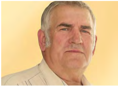
HAIMUR PUK KANDIDAAT 129:

50 a., vabaabielus, tütar. Töötan kinnisvara korrashoiuga tegeleva firma juhatajana. Eesti Korteriühistute Liidu Nõukogu esimees. Oman töökogemust Rae Vallavolikogus 2002-2005a. Soovin volikogus olles, et Valda juhitaks demokraatlikult, asjatundlike inimestega Vald toetaks korteriühistuid Lagedile oma spordihoone Lagedile renoveeritud koolihoone