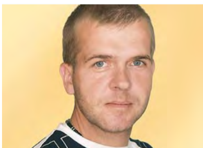
IVO KODU KANDIDAAT 134:

63 a., pensionär, abielus, 2 tütar, 3 lapselast. Praeguse volikogu haridus- ja kultuurikomisjoni liige ning sotsiaalkomisjoni liige. Kümme aastat olnud Lagedi Põhikooli hoolekogu liige ja kaasa löönud Lagedi kodukandi liikumise klubi tegevuses. Lisaks meeldib koduaias nokitseda.