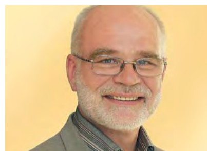
AGU LAIUS KANDIDAAT 118:

39 a., abielus, peres kasvab 2 poega (9a ja 12a), kes õpivad Lagedi koolis. Olen koolitaja ja õppejõud. Minu tööks on tellerite ja Postipanga klienditeenindajate koolitamine. Lapsevanemana ja endise õpetajana seisan hea hariduse- ja sportimistingimuste parendamise eest Lagedil.