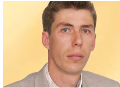
ANDRES SUITSO KANDIDAAT 130:

62 a., peres 1 laps ja 1 lapselaps. Elukutselt agronoom. Karla külavanem. 1985~2006 töötanud ettevõtte tegevjuhina. Tahan ellu viia sadevete süsteemide väljaehitamise ning eurorahade eest vee- ja kanalisatsioonide välja ehitamise Pirita jõe piirkonnas.